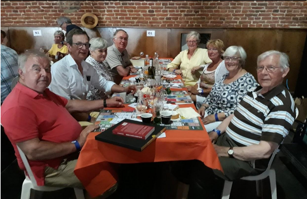
Table Tubize, Villers et Ottignies à la Beef de Wavre le 23 juin 2019